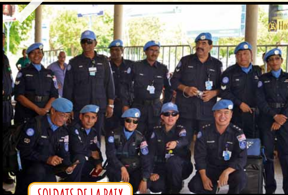
SOLDATS DE LA PAIX

➔ Voici l'un des derniers bataillons de Casques bleus de l'ONU avant leur départ, fin 2012. Quand on est arrivés, ils étaient partout, j'avais l'impression d'être dans un journal télévisé !