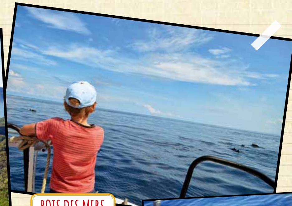
ROIS DES MERS

➔ On a grimpé le mont Ramelau, le point culminant du Timor oriental (2963 mètres). Ma petite sœur était à dos de cheval, car c'était trop escarpé pour elle.