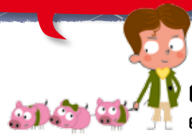
Gaston et ses cochons

Si ça se trouve, jamais tu nous trouves !