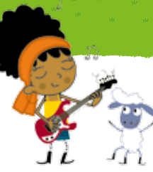
Sonate et son mouton à cinq pattes