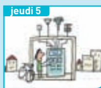
Comment mesure-t-on la pollution ?