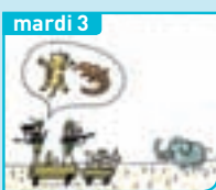
C'est quoi, le trafic d'animaux sauvages ?