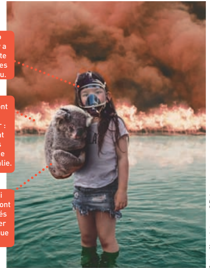
Capture d'écran Instagram

Le koala, ainsi que le masque, ont aussi été ajoutés pour augmenter l'effet dramatique de la scène.