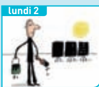
C'est qui, Soutages ?