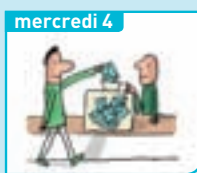
Comment est organisé le scrutin municipal ?